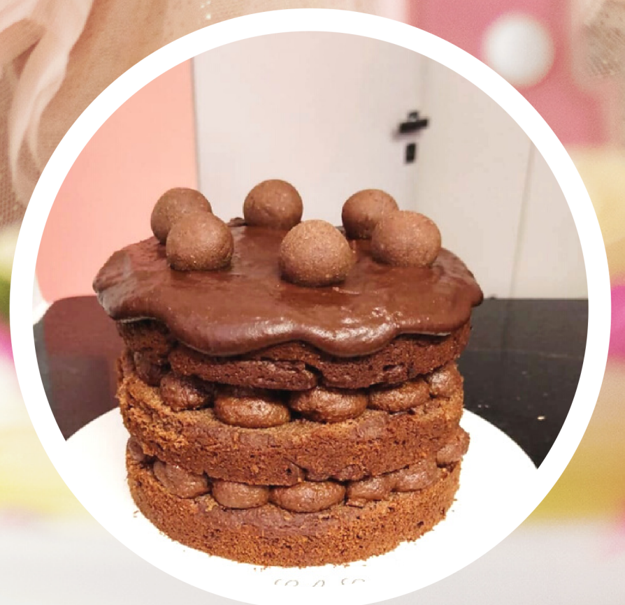
Decoração OPÇÃO 3