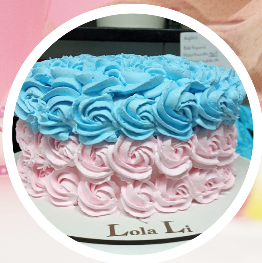
Decoração OPÇÃO 1 E 2

Três discos de bolo de cacau adoçado com tâmaras e uva passas empilhados, recheio e cobertura de "brigadeiro" cremoso adoçado tâmaras e uva passas . Decoração padrão como o modelo da foto. Essa opção não permite usar corantes. Nesse caso, a criança se lambuza de "chocolate".